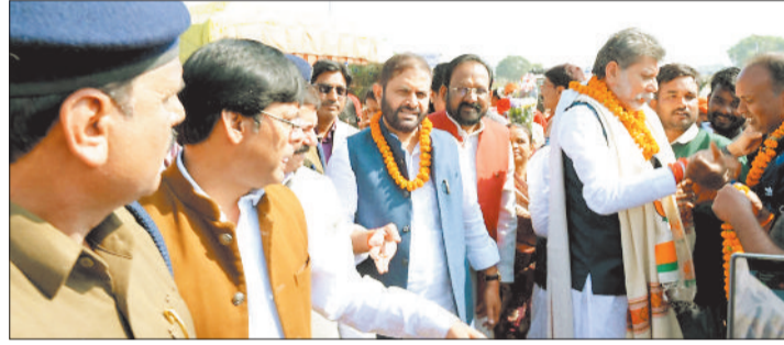
भाजपा प्रदेशाध्यक्ष का स्वागत करते भाजपाई।