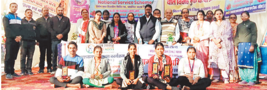
हरिभूमि न्यूज. बैकुण्ठपुर

भारत सरकार महिला एवं बाल विकास विभाग द्वारा जिलों में बाल विवाह मुक्त जिला बनाए जाने के लिए लक्ष्यों को प्राप्त करने की दिशा में रस्ताक्षेप की गति को तेज करने के लिए 100 दिवस का विषयगत अभियान संचालित किया जाना है। इस अभियान के प्रथम चरण में बाल विवाह मुक्त कोरिया अभियान अंतर्गत विद्यालय और महाविद्यालयों में जागरूकता कार्यक्रम आयोजित किया जाना है। अभियान अंतर्गत बाल विवाह मुक्त कोरिया अभियान