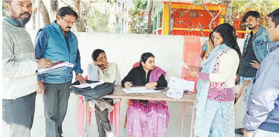
हरिभूमि न्यूज. चरचा कॉलरी

नगर पालिका शिवपुर चरचा में शासन की अत्यंत महत्वपूर्ण प्रक्रिया एसआईआर (सोशल इकोनॉमिक रजिस्ट्रेशन) को पूरा करने के लिए प्रशासन लगातार प्रयासरत है। सभी वार्डों में बीएलओ और नगर पालिका कर्मचारियों की ड्यूटी लगाई गई है, फिर भी कई नागरिकों द्वारा अब तक फार्म नहीं भरावाए जाने से कार्य की गति चिंताजनक स्तर तक घीमी हो गई है।